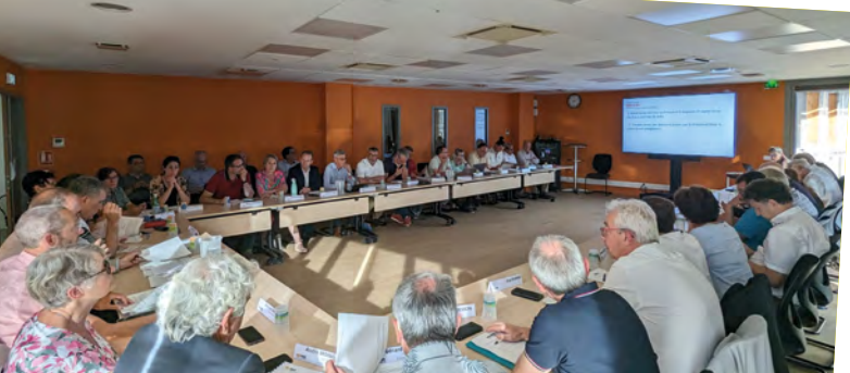
Les 37 délégués du comité syndical en séance