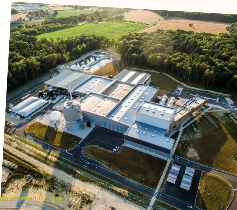
Vue aérienne de l'usine Ovade

Dans ce contexte, Organom doit répondre aux contraintes réglementaires tout en faisant face à des enjeux économiques.