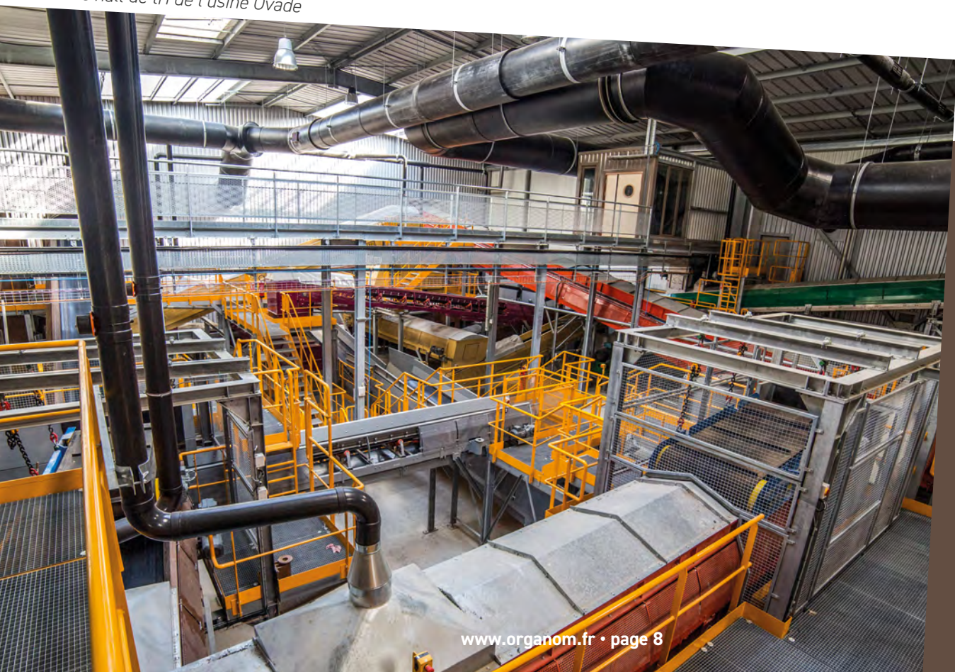
Le hall de tri de l'usine Ovade

Organom n'exerce aucune influence sur ces choix. Ils appartiennent à chaque collectivité.