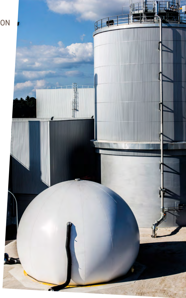
Le méthaniseur d'Ovade

La hausse du coût des déchets facturée aux habitants est liée à Organom.